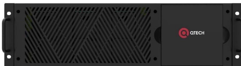
Рисунок 1. Вид передней панели